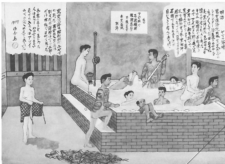
「明治 ヤマの浴場」(1977年)